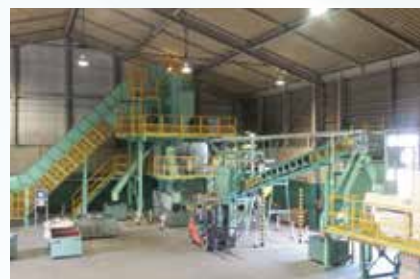
家電部品一括破碎選別ライン