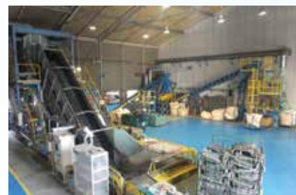
熱交換器破碎選別ライン